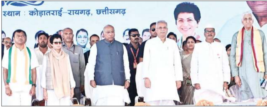
स्थान : कोड़तराई-रायगढ़, छत्तीसगढ़

नेता प्रतिपक्ष राज्यसभा, सांसद श्री मल्लिकार्जुन खड़गे ने अपने संबोधन की शुरुआत जय जोहार जय छत्तीसगढ़ महतारी के नमन के साथ किया। उन्होंने कहा कि ऐसा सम्मेलन शायद देश के किसी कोने में, किसी भाग में नहीं हुआ। ये गर्व की बात है कि छत्तीसगढ़ में मुख्यमंत्री श्री भूपेश बघेल के नेतृत्व में हर जगह भरोसे का सम्मेलन का आयोजन हो रहा है, जो सरकार के प्रति लोगों के विश्वास को दर्शाता है। मल्लिकार्जुन खड़गे ने आगे कहा कि छत्तीसगढ़ में