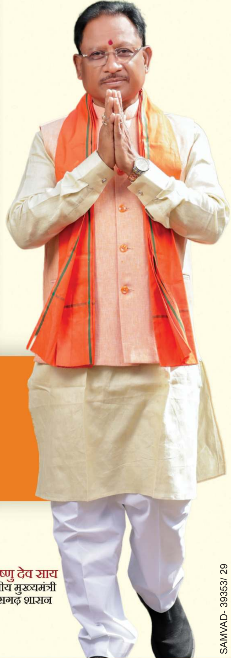
श्री विष्णु देव साय माननीय मुख्यमंत्री छत्तीसगढ़ शासन

18 लाख से अधिक गरीब परिवारों को निःशुल्क आवास