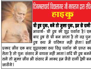
दिग्गजराधार विद्यासागर जी महाराज द्वारा रचित हाइड्रू

ही दूध पूज, बने तो गुण पूज, इन के छोली भावार्थ- मी दूध की गुण पराज है। एक बार दूध से भी बज जाता है तो वह पुणः दूध रूप में परिणत नहीं होता। इसी प्रकार जीव एक बार शुद्धराश्या रूप लिहा पराज की प्राप्त कर लेता है तो पुनः संसार में पापत्र नही आता। यदि मी दूध बनने लगे तो गुण जीव भी संसार में आकर हम जैसे राणी देवी बन जाते हैं।