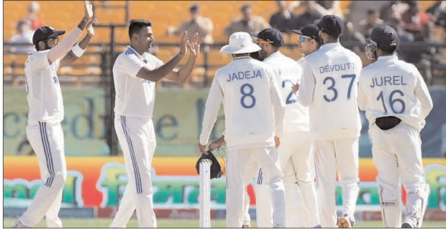
नाम करने वाली सिर्फ चौथी टीम बनी है। पिछली बार यह कारनामा 112 साल पहले हुआ था। इंग्लैंड ने 1911-12 में ऑस्ट्रेलिया को 5 मैच की एशेज सीरीज में पहला टेस्ट हारने के बाद 4-1 से ही मात दी थी। ऑस्ट्रेलिया ने अपनी घरेलू सरजमा पर इंग्लैंड के खिलाफ साल 1897-98 और साल 1901-02 में यह कारनामा किया था। भारतीय टीम पहले मुकाबले

नई दिल्ली (एजेंसी)। भारतीय क्रिकेट टीम ने गत शनिवार को टेस्ट सीरीज के 5वें टेस्ट में इंग्लैंड क्रिकेट टीम को पारी और 64 रन से हराकर सीरीज पर 4-1 से कब्जा जमा लिया। सीरीज के पहले मैच में करारी हार झेलने के बाद भारतीय टीम ने जोरदार वापसी करते हुए कमाल कर दिखाया। बड़ी बात यह है कि भारत ने न केवल सीरीज अपने नाम की, बल्कि कई बड़े रिकॉर्ड भी धराशाही कर दिए। भारत 5 सालों से ज्यादा मैच की टेस्ट सीरीज में पहला मैच हारने के बावजूद 4-1 से सीरीज अपने