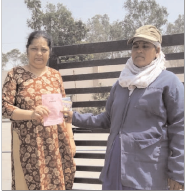
सार्वजनिक व औद्योगिक प्रतिष्ठानों, संस्थानों व सभी की सहभागिता देखने को मिल रही है। लोकसभा चुनाव के लिए 07 मई मंगलवार को मतदान होना है। कलेक्टर एवं जिला निर्वाचन

कलेक्टर एवं जिला निर्वाचन अधिकारी का आमंत्रण पत्र व मतदाता मार्गदर्शिका देकर मतदाताओं से कर रही आग्रह, 07 मई को अवश्य करें मतदान