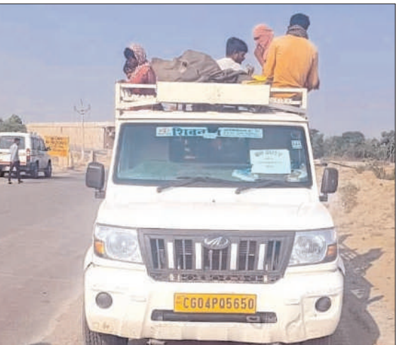
एक हादसा कोरबा जिले में भी सामने आया। इन घटनाओं की रोकथाम को लेकर प्रशासन व पुलिस द्वारा लगातार जांच एवं

कोरबा (विश्व परिवार)। कोरबा जिलान्तर्गत शहरी और ग्रामीण इलाके में बस या ऑटोरिक्षे के सुरक्षित सफर के विपरीत खासकर ग्रामीण क्षेत्रों में लोग पिकअप या मेटाडोर जैसे खुले डाले के वाहनों में खतरा मोल लेकर आना-जाना करते हैं। ऐसे में हुआ मा छोटा हादसा भी बड़े नुकसान का कारण बन सकता है। ऐसे कई मामले सामने आए हैं, जिनमें मालवाहकों पर बैठे सवारियों को जानलेवा दुर्घटना का शिकार बनना पड़ा। हाल ही में बड़ी दुर्घटना कवर्धा और उसके बाद