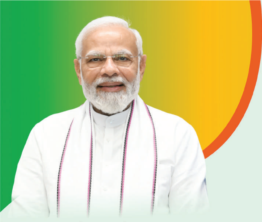
श्री नरेन्द्र मोदी माननीय प्रधानमंत्री