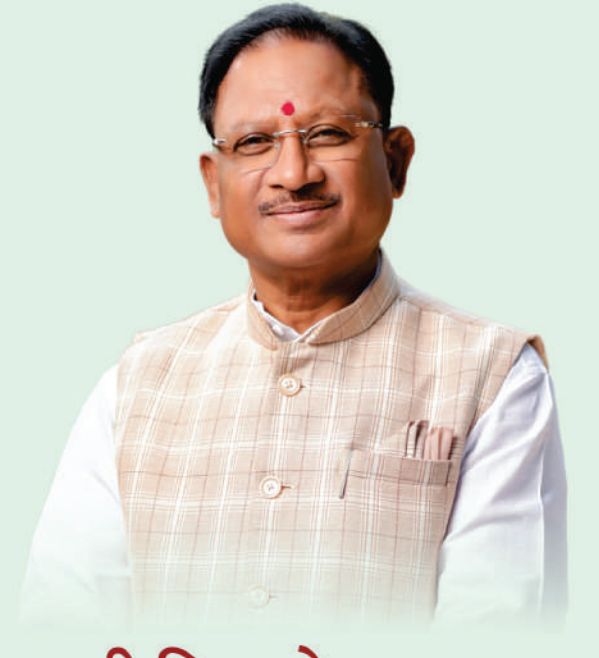
श्री विष्णु देव साय मुख्यमंत्री, छत्तीसगढ़