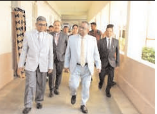
अनुभाग, प्रतिलिपि अनुभाग, ज्यूडिशियल सर्विस सेंटर सहित पूरे कोर्ट परिसर का अवलोकन किया। शाखा प्रमुखों से उनके प्रभार की जानकारी लेते हुए प्राप्त