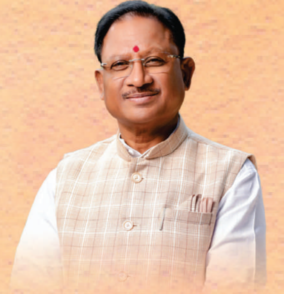
श्री विष्णु देव साय मुख्यमंत्री, छत्तीसगढ़