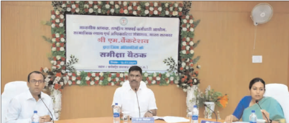
कर्मचारियों को दी जा रही वेतन, सफाई सामग्री, यूनिफॉर्म, सुरक्षा उपकरण, पीएफ ईएसआईसी कार्ड के संबंध में जानकारी ली। अध्यक्ष श्री वेंकटेशन ने निर्देशित किया कि सफाई कर्मचारियों को एजेंसी द्वारा एग्रीमेंट के तहत सभी प्रकार की सुविधाएं प्रदान की जानी चाहिए। एग्रीमेंट का पालन नहीं करने वाली एजेंसियों के विरुद्ध उन्होंने कार्यवाही के निर्देश भी दिए। उन्होंने सफाई कर्मियों का श्रम कार्ड बनाने तथा शासन द्वारा चलाई जा रही कल्याणकारी योजनाओं का लाभ भी सफाई कर्मचारियों को उपलब्ध कराने के निर्देश दिए। बैठक में कलेक्टर श्री अजीत वसंत ने आयोग के अध्यक्ष द्वारा दिए गए निर्देशों एवं सफाई कर्मचारियों यूनियन के प्रतिनिधियों द्वारा उठाए गए समस्याओं का नियमानुसार निराकरण करने की बात कही।

राष्ट्रीय सफाई कर्मचारी आयोग के अध्यक्ष ने ली अधिकारियों की बैठक अध्यक्ष ने सफाई कर्मियों से वन टू वन चर्चा कर जानी उनकी समस्याएं