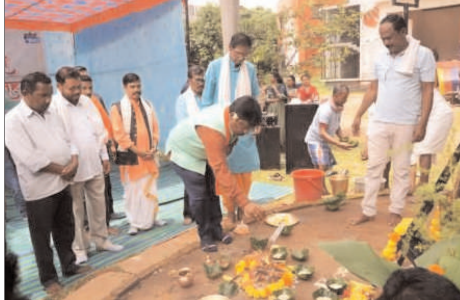
उल्लेखनीय भूमिका निभा रही है। हरेली त्योहार को बस्तर में अमूस तिहार के रूप में जाना जाता है। उन्होंने कहा कि संस्कृति को बनाने और बचाने के लिए लाखों ने बलिदान दिया है, आदिवासी समाज, संस्कृति परम्परा को संरक्षित करने में अमूल्य योगदान दिया है। हरेली क्षेत्र का पहला पर्व है इसमें हमारे जरूरी और कृषि से संबंध औजारों का पूजा किया जाता है। आदिवासी समाज पहले से ही