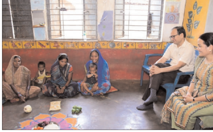
अभियान अंतर्गत पालक चौपाल में बच्चों के पालकों को बहुत ही सरल तरीके से अपने बच्चे को अच्छे खान-पान से बच्चों का वजन बढ़ाने और स्वस्थ रखने के