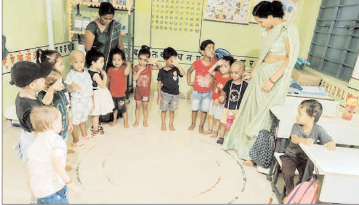
आंगनबाड़ी केंद्रों का संचालन खुद के सुविधायुक्त भवन में होने से सभी आंगनबाड़ी केंद्रों में 25 से 30 बच्चे नियमित रूप से पहुंच रहे हैं मातृशक्ति को