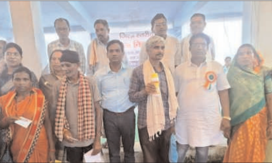
योजनाओं की जानकारी से मांगों, शिकायत और समस्याओं अवगत कराया गया। शिविर में से संबंधित कुल 69 आवेदन प्राप्त हुए, आवेदनों के निराकरण के लिए समय सीमा निर्धारित करने

मोहला(विश्व परिवार)। ग्रामीणजनों की मांगों, शिकायतों और समस्याओं को सुनने के उद्देश्य से जिले के मानपुर विकासखंड के ग्राम पंचायत भरीटोला में जिला स्तरीय जन समस्या निवारण शिविर का आयोजन किया गया। शिविर में जिले के सभी विभाग के द्वारा स्टाॅल के माध्यम से नागरिकों की समस्याओं को सुना गया। साथ ही शिविर स्थल पर ही विभागीय