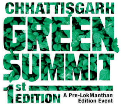
जागरूकता कार्यक्रमों के माध्यम से, यह सम्मेलन स्वदेशी लोगों को बहुमुखी टिकाऊ प्रथाओं और पर्यावरण पर उनके दृष्टिकोण का प्रता लगाएगा, और प्रतिभागियों के लिए सीखने के अवसर प्रदान करेगा।

रायपुर (विश्व परिवार)। राष्ट्रीय प्रौद्योगिकी संस्थान रायपुर और विजयपुर (एन.ई. फाउंडेशन) को यह बताते हुए हर्ष हो रहा है कि 3 से 5 अक्टूबर, 2024 तक रायपुर के पॉडिस्ट दीनदयाल उपाध्याय ऑडिटोरियम में छत्तीसगढ़ ग्रीन समिट (लोक विर्याड फोक) का आयोजन किया जाएगा। पहले ये कार्यक्रम 26 से 28 सितंबर के लिए प्रस्तावित था लेकिन अब इसकी तारीखों में परिवर्तन किया गया है। प्रविष्टित लोकमंथन 2024 का इम्यूट यह सम्मेलन छत्तीसगढ़ की समृद्ध प्राकृतिक और सांस्कृतिक विरासत का जहन मनाने और उसे बढ़ावा देने के साथ-साथ पर्यावरण संरक्षण और संवर्धन की दिशा में महत्वपूर्ण कदम के रूप में आयोजित किया जाएगा, जो हमारी स्वदेशी परंपराओं में निहित हैं।