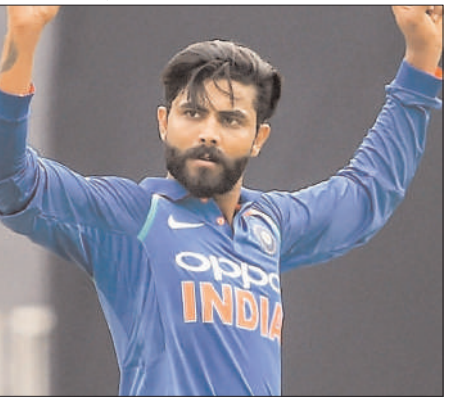
विटोरी-चॉन की इस सूची में शामिल

कानपुर (एजेंसी)। भारत और बांग्लादेश के बीच कानपुर में खेले जा रहे टेस्ट में रवींद्र जडेजा ने कहर बरपाते हुए तीन विकेट ले लिए हैं। उन्होंने मैच के पांचवें दिन बांग्लादेश की दूसरी पारी में तीन विकेट झटके। जडेजा ने बांग्लादेशी कप्तान नजमुल हुसैन शातो