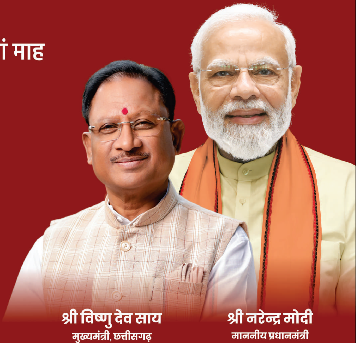
श्री विष्णु देव साय मुख्यमंत्री, छत्तीसगढ़

मुख्यमंत्री विष्णु देव साय से जुड़ने के लिए QR CODE स्कैन करें