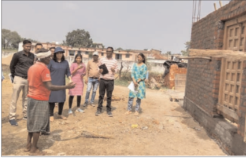
हितग्राही द्वारा आवास निर्माण कार्य सबसे पहले पूर्ण किया जाएगा, उनको सम्मानित किया जाएगा। जिन पर हितग्राहियों ने आवास निर्माण कार्य शीघ्र पूर्ण कराने की बात कही। उन्होंने योजना से संबंधित अधिकारियों को हितग्राहियों से समन्वय कर लगातार आवास निर्माण की देखरेख एवं निगरानी करने तथा हितग्राहियों को तकनीकी

राजनादगांव (विश्व परिवार)। मुख्य कार्यपालन अधिकारी जिला पंचायत सुरुचि सिंह ने जनपद पंचायत डोंगरगढ़ के ग्राम पेण्ड्री, अन्यान्यवागांव, खैरा, खुडमुडी में प्रधानमंत्री आवास योजना-ग्रामीण अंतर्गत स्वीकृत निर्माणाधीन आवासों का निरीक्षण किया। सीईओ ने योजनांतर्गत स्वीकृत निर्माणाधीन आवासों के हितग्राहियों से संपर्क कर आवास निर्माण के संबंध में जानकारी ली। उन्होंने हितग्राहियों को आवास निर्माण कार्य जल्द से जल्द पूरा कर संपूर्ण किस्त की राशि अतिशीघ्र प्राप्त करने कहा। उन्होंने कहा कि ग्राम में जिन