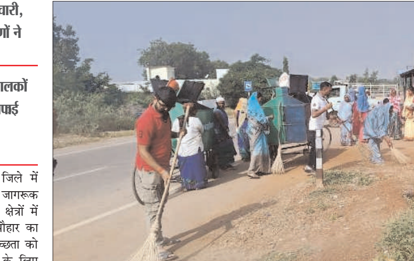
निर्देशन में ग्रामीणों को स्वच्छता के प्रति व्यवहार परिवर्तन, घर-घर कचरा एकत्रित करने, एसएलडब्ल्यूएम में कचरा का पृथक्करण करने का संदेश दिया गया। जनपद पंचायत छुरिया के ग्राम पंचायत खुन्जी में आयोजित स्वच्छता त्यौहार में जनप्रतिनिधि, अधिकारी, कर्मचारी, समूह के महिलाएं, स्कूली बच्चों तथा ग्रामीणों ने बड़-चढ़ के हिस्सा लिया और ग्राम के बाजार चौक सहित अन्य प्रमुख चौक-चौराहों, मुख्य मार्गों की साफसफाई की। ग्राम पंचायत द्वारा दुकानदारों से कचरा के