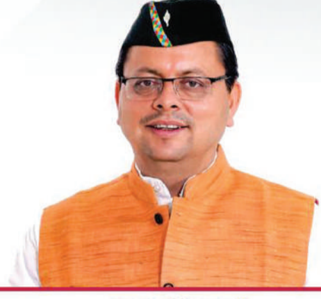
पुष्कर सिंह धामी मुख्यमंत्री, उत्तराखण्ड