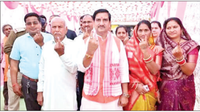
केंद्रीय राज्य मंत्री तोखन साहू ने परिवार सहित मतदान किया

दूसरे चरण में जिला पंचायत के 699 कैडिडेट्स : दूसरे चरण में 26 हजार 988 पंच पद, 3 हजार 774 सरपंच पद, 899 जनपद सदस्य और 138 जिला पंचायत सदस्य के लिए चुनाव हुआ है। इसके लिए 9 हजार 738 मतदान केंद्र बनाए गए थे। वहीं पंच के 65 हजार 716, सरपंच के 15 हजार 217, जनपद सदस्य के 3 हजार 885 और जिला पंचायत सदस्य के लिए 699 कैडिडेट्स चुनाव लड़ रहे हैं। 46 लाख 83 हजार से अधिक मतदाता