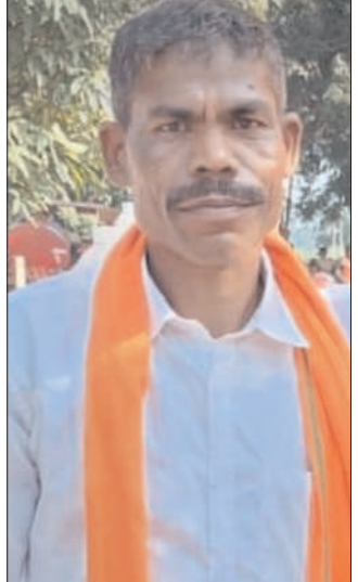
ने फ़ैने से इधर उधर बात किये पोस्टमार्टम न कराने मामला दर्ज न कराने ताल मटोल होता रहा फिर पुनः शव को बफ्ना से माकड़ी ले जाकर