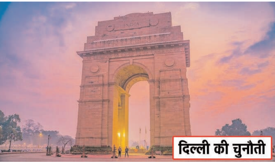
दिल्ली की चुनौती

मेट्रो और सड़कों के लिए जानी जाने लगी। लेकिन अरविंद केजरीवाल के शासन में दिल्ली का विकास लगभग रुक गया। पिछले 11 वर्षों में शायद ही कोई नया फ्लाइओवर, विद्यालय, महाविद्यालय अथवा विश्वविद्यालय अथवा अस्पताल बना होगा। हालांकि अरविंद केजरीवाल अपने शिक्षा मॉडल को विश्वस्तरीय बनाने और अपने मोहल्ला क्लीनिक मॉडल को सफलता बनाने में जुटे रहे, लेकिन जमीनी सच्चाई अलग ही कहानी बयान कर रही थी। समझा जा सकता है कि सरकारी खर्च को मुफ्त की योजनाओं पर केंद्रित करते हुए, जो विकास और सार्वजनिक सेवाओं को तिलांजलि देने का जो काम अरविंद केजरीवाल सरकार ने किया, उस नीति को उलटकर फिर से विकास को केंद्र में लाना जरूरी होगा। यमुना की सफाई और पर्यटन : दशकों की अनदेखी और यमुना में फेक्टोरियों के प्रदूषण और अन्य गंदगी को यमुना में डालते जाने और केंद्र तथा दिल्ली के बीच तालमेल के अभाव के चलते यमुना की गंदगी इन चुनौतियों में मुख्य मुद्दा रही। केजरीवाल ने भी स्वीकार किया कि वे यमुना की सफाई का काम नहीं कराए। नई सरकार के सामने यह चुनौती रहेगी कि वादे के अनुसार वह यमुना की सफाई के काम को आगे बढ़ाए। यमुना की सफाई और नदी तट का सौंदर्यकरण कोई असंभव काम नहीं है। लेकिन ऐसा करके दिल्ली को न केवल सुंदर बनाया जा सकता है, बल्कि यमुना तट को पर्यटन का आकर्षक केंद्र भी बनाया जा सकता है। दुनिया भर में नदियां