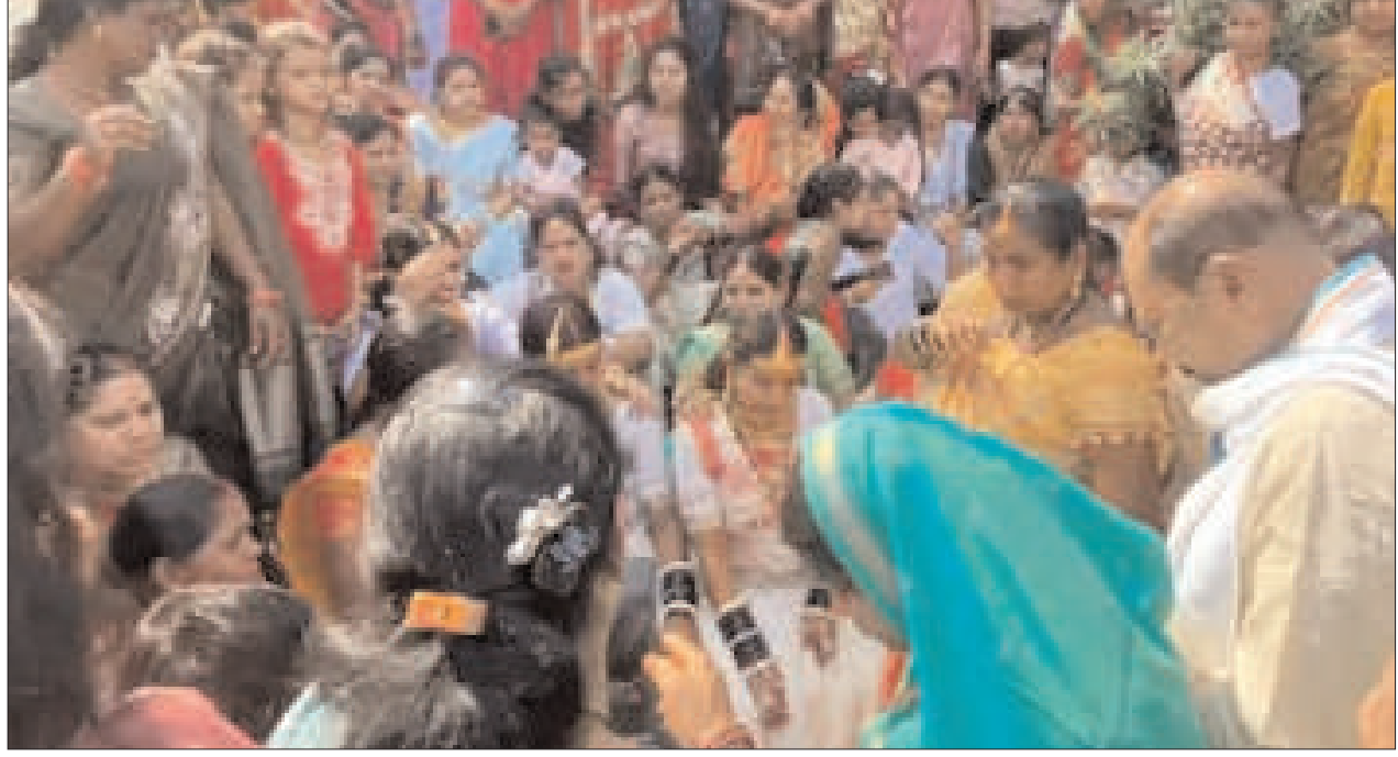
कोर्तन और श्रद्धालुओं की भीड़ शोभायात्रा प्रारंभ हुई, भक्तगण जय मां परमेश्वरी के जयकारे लगाई गई थी। द्वारों को सजाया गया। शोभायात्रा में देवी की सजीव झांकी आकर्षण का केन्द्र रही, जिसमें माता परमेश्वरी को भव्य रूप में सजाया गया था।