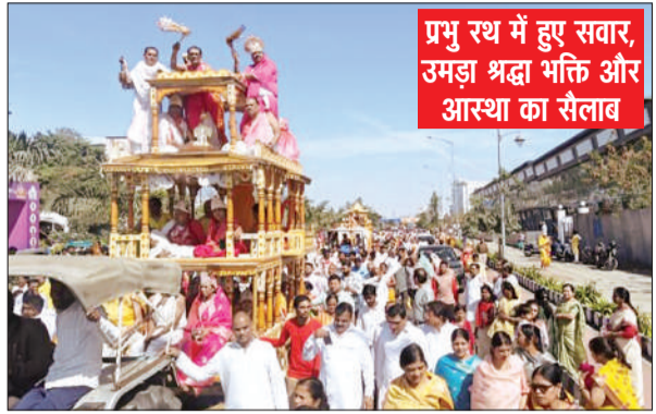
प्रभु रथ में हुए सवार, उमड़ा श्रद्धा भक्ति और आस्था का साँवला

भोपाल (विश्व परिवार)। भोपाल टी टी नगर जैन मंदिर पंच कल्याणक महोत्सव का समापन मोक्ष कल्याणक की आराधना के साथ हुआ, प्रभु को मोक्ष प्राप्ति के साथ भोपाल के मंदिरों की 84 जिन प्रतिमाएं पाषाण से भगवान बनी भगवान जिनेंद्र की पूजा अर्चना के साथ विश्व शांति की कामना के साथ हवन कुंड में मंत्रोच्चारित आहुतियां दी गईं, अनुष्ठान के प्रतिष्ठाचार्य के निर्देशन में विश्व विधान से अनुष्ठान हुए, आयोजन स्थल अयोध्या नगरी से भव्य गजथ शोभा यात्रा निकली मीडिया प्रभारी सुनील जैनावन ने बताया केसरिया धर्म ध्वजाएं लहराती हुई विश्व शांति बंधुत्व का संदेश दे रही थीं, विभिन्न मंदिरों के युवा मंडल के दिव्य घोष जय अरिहंत, जय जिनेंद्र के जय कारो के साथ वातावरण को भक्ति मय बना रहे थे, शोभा यात्रा में प्रभु के पांच रथ श्रद्धा भक्ति आस्था के केंद्र थे, जिसे स्पर्श करने श्रद्धालुओं में होड़ बची हुई थी, शोभायात्रा के पूरे मार्ग पर श्रद्धालु हर्षित और प्रफुल्लित भाव से भक्ति नृत्य कर रहे थे, सभी अपने प्रभु के मोक्ष प्राप्ति पर अपने भक्ति भावों से वंदना आराधना कर रहे थे, प्रतीकात्मक हाथी रथ और बागियों पर अनुष्ठान के