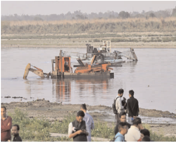
कमल नैन नारंग