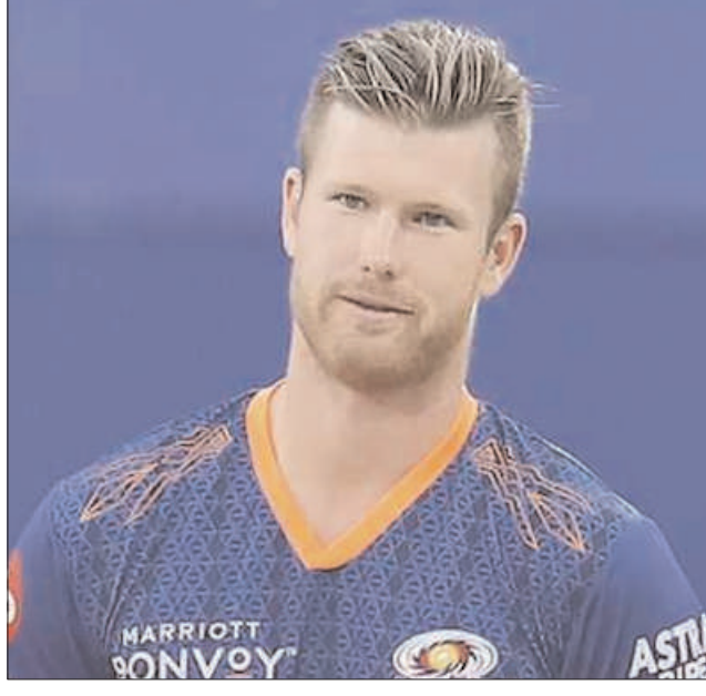
न्यूजीलैंड बनाम पाकिस्तान

नई दिल्ली (एजेंसी)। न्यूजीलैंड क्रिकेट टीम और पाकिस्तान क्रिकेट टीम के बीच 5 मैचों की टी-20 सीरीज के आखिरी मुकाबले में जिमी नीशम ने घातक गेंदबाजी करते हुए 5 विकेट हॉल अपने नाम किए। ये उनके टी-20 अंतरराष्ट्रीय करियर का पहला 5 विकेट हॉल रहा। उनकी शानदार गेंदबाजी के कारण पाकिस्तान की पूरी टीम 20 ओवर में 128/9 का ही स्कोर बना पाई। इस मुकाबले से पहले उनका सर्वश्रेष्ठ प्रदर्शन 3/16 का था। ऐसे में आइए उनके आंकड़ों पर नजर डालते हैं। नीशम ने 4 ओवर गेंदबाजी की और 22 रन देकर 5 बल्लेबाजों को पवेलियन भेजा। उनकी इकॉनमी रेट 5.50 की रही। उन्होंने आधा सलमान (51), अब्दुल समद (4), शादाब खान