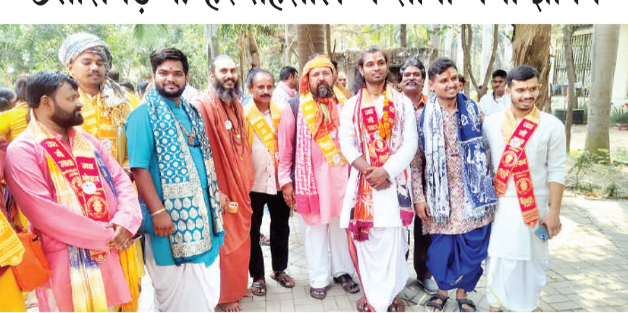
रायपुर तिल्ला नेवरा (विश्व परिवार)। आज 27 अप्रैल 2026 को पूरे भारत में सभी तहसील ऑफिस पहुंचकर तहसीलदार महोदय को राष्ट्रपति, प्रधानमंत्री, राज्यपाल, मुख्यमंत्री के नाम प्रार्थना पत्र व ज्ञान सौंपा गया जिसमें प्रमुख मांग भारत में गौ हत्या पूर्णतया बंद हो, गौ माता जी को राष्ट्र माता का घोषित किया जाये, एवं भारत देश के कोने कोने पर घूम रहे गौ माता जी को सुरक्षित स्थान में रखने प्रत्येक पंचायत में गौ शाला का निर्माण कर, प्रत्येक गौ शाला में एक