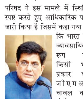
अनुमति नहीं है। परिषद ने यह भी स्पष्ट किया है कि भारत से निर्यात होने वाला सारा चावल पूरी तरह से गैर जीएमओ श्रेणी का है। इसके बावजूद चीन के कस्टम विभाग ने तीन भारतीय कंपनियों को निर्लंबित कर दिया है जिससे व्यापारिक अनुबंधों में अनिश्चितता पैदा हो गई है। छत्तीसगढ़ के निर्यातकों का कहना है कि वे सभी निर्धारित मानकों का पालन करते हैं और शिपमेंट से पहले अधिकृत प्रयोगशालाओं से आवश्यक

■ भारतीय चावल पर चीन के जीएमओ आरोपों से हड़कंप निर्यातकों ने केंद्र सरकार से मांगी कूटनीतिक मदद