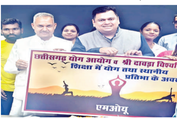
विशेष रूप से सम्मानित किया गया। साथ ही, दिनांक 13 अक्टूबर 2025 को सर्फिट हाउस, रायपुर में आयोजित अंतर्राष्ट्रीय योग कार्यशाला के सफल एवं उत्कृष्ट आयोजन हेतु भी उन्हें सराहना प्रदान की गई। इस एमओयू के अंतर्गत भविष्य में राष्ट्रीय एवं अंतर्राष्ट्रीय स्तर पर कॉन्फ्रेंस एवं सेमिनारों का संयुक्त आयोजन किया जाएगा। इसके अतिरिक्त योग वाटिका, एक्स्प्रेसर गार्डन एवं

रायपुर (विश्व परिवार)। श्री दावड़ा यूनिवर्सिटी एवं छत्तीसगढ़ योग आयोग के मध्य एक महत्वपूर्ण समझौता ज्ञान (एमओयू) संपन्न हुआ। यह समझौता विश्वविद्यालय के योग विज्ञान विभाग का पहला आधिकारिक एमओयू है, जो संस्थान के शैक्षणिक एवं सामाजिक विस्तार की दिशा में एक महत्वपूर्ण पहल माना जा रहा है।