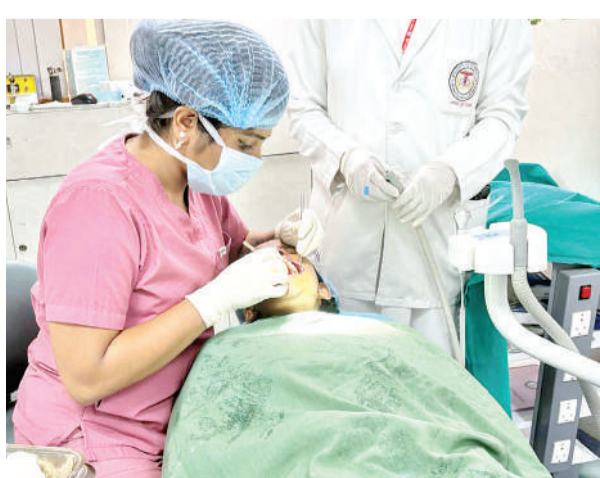
महामारी विज्ञान अध्ययन के आधार पर विकसित किया गया है। इस पहल के महत्व को रेखांकित करते हुए कहा गया कि यह कार्यक्रम एक गंभीर जनस्वास्थ्य आवश्यकता पर आधारित है। World Health

रायपुर (विश्व परिवार)। समावेशी स्वास्थ्य सेवा की दिशा में एक अग्रणी कदम उठाते हुए AIIMS Raipur ने विशेष स्वास्थ्य आवश्यकताओं वाले बच्चों (Children with Special Health Care Needs - SHCN) के लिए एक महत्वपूर्ण मौखिक स्वास्थ्य पहल (Oral Healthcare Initiative) की शुरुआत की है। यह पहल समाज के सबसे उपेक्षित वर्गों में से एक के लिए शोध-आधारित साक्ष्यों को व्यवहार में उतारने की दिशा में एक महत्वपूर्ण प्रयास है। यह कार्यक्रम बाल एवं निवारक दंत चिकित्सा विभाग द्वारा रायपुर जिले में किए गए विस्तृत