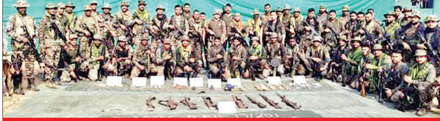
नक्सलियों द्वारा जंगल और पहाड़ी क्षेत्रों में छिपाकर रखे गए भारी मात्रा में हथियार बरामद

नष्ट कर दिया। मिली जानकारी के अनुसार 16 मई 2026 को ऑपरेशन फ्लडिंग स्ट्राइक के तहत गढ़चिरोली पुलिस बल के समक्ष आत्मसमर्पण करने वाले माओवादियों से गहन पूछताछ के दौरान यह सूचना प्राप्त हुई कि माओवादियों ने पोककेन के बिनगुंडा क्षेत्र के वन क्षेत्र में हथियार और अन्य सामग्री छिपा रखी है। 21 मई 2026 को गढ़चिरोली के पुलिस अधीक्षक एम. रमेश के मार्गदर्शन में गढ़चिरोली और प्राणहिता की विशेष अभियान टीम की 6 संयुक्त टीमों और बीडीडीएस की 2 टीमों उक्त वन क्षेत्र में तलाशी अभियान चलाने भेजे गईं। 21 मई 2026 को जब विशेष अभियान दल ने पोककेन बिनगुंडा के उत्तर में स्थित वन क्षेत्र को घेर लिया।