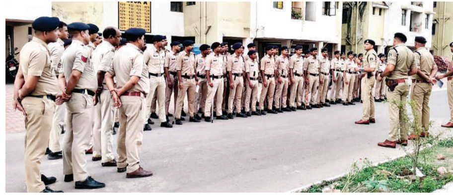
आमजन से अपील की गई कि किसी भी संदिग्ध व्यक्ति अथवा गतिविधि की सूचना तत्काल

संबंधित आवश्यक जानकारी दी गई। पुलिस टीम द्वारा मकान मालिकों को हिदायत दी गई कि वे अपने किरायेदारों का पूर्ण विवरण एवं किरायानामा संबंधित थाना में अनिवार्य रूप से जमा करें, ताकि क्षेत्र में सुरक्षा व्यवस्था एवं संदिग्ध गतिविधियों पर प्रभावी निगरानी रखी जा सके। साथ ही किरायेदारों को कानून व्यवस्था बनाए रखने एवं पुलिस सत्यापन प्रक्रिया में सहयोग करने हेतु समझाइश दी गई। पुलिस द्वारा