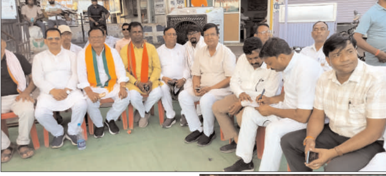
86 प्रतिशत मतदाताओं ने बंपर किया वोटिंग

अध्यक्ष एवं पार्षद प्रत्याशियों का किस्मत वोटिंग मशीन में 4 जून तक के लिए हुआ कैद