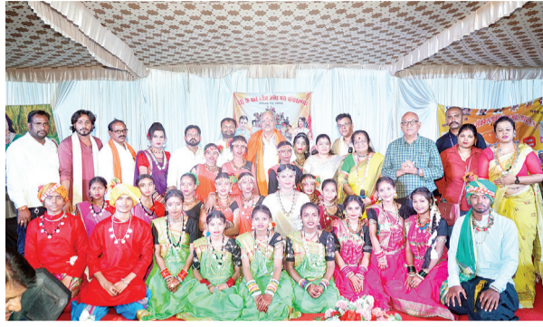
कलाकारों की जमकर सराहना की।

सांसद ने 'पैरी के धार' ग्रुप की जोशी बहनों और कलाकारों की थपथपाई पीठ