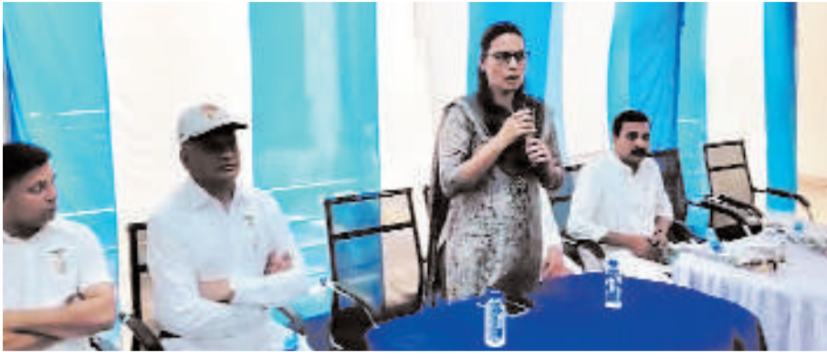
आंतरिक शक्तियां हैं जिसे राजयोग मेडिटेशन के अभ्यास से हमारे व्यवहार और स्वरूप में लाना है। निगेटिव विचार से मन को बैटरी जल्दी डिस्चार्ज होती है