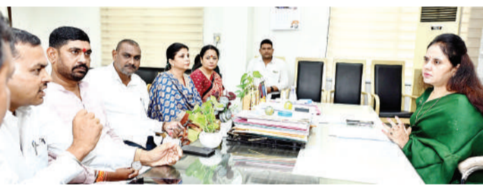
उपलब्ध 25 सफाई कामगारों के गैंग में कमी भी शत प्रतिशत उपस्थिति नहीं देखी जाती एवं सफाई कामगारों की उपस्थिति कम रहती है। इसके चलते जोन 6 के वार्डों में बारिश पूर्व गंदे पानी का निकास सुगम बनाने अच्छी सफाई व्यवस्था अभी तक कायम नहीं हो पा रही है।