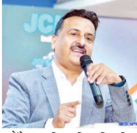
उन्होंने स्पष्ट किया कि यदि महिला को भी गिफ्ट दिया जा रहा हो, तब भी पूर्ण स्टॉप ड्यूटी देय होती है। वहीं यदि प्रॉपर्टी किसी रिश्तेदार को गिफ्ट डीड के माध्यम से दी जाती है, तो स्टॉप ड्यूटी मात्र 1.5 प्रतिशत तथा रजिस्ट्रेशन फीस केवल 500 रुपये देनी होती है। उन्होंने बताया कि स्टॉप एक्ट के अंतर्गत रिश्तेदारों की परिभाषा में पिता, माता, पति-पत्नी, पुत्र, पुत्री, पोता-पोती, नाती-नातिन,