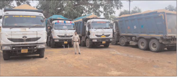
मामले की गंभीरता को देखते हुए पुलिस ने आगे की वैधानिक एवं दंडात्मक कार्रवाई के लिए खनिज विभाग और राजस्व विभाग को विस्तृत प्रतिवेदन भेज दिया है। संबंधित विभागों द्वारा नियमों के तहत आगे की कार्रवाई की जाएगी। गरियाबंद पुलिस ने स्पष्ट किया है कि

पुलिस अधीक्षक के दिशा-निर्देश और मार्गदर्शन में चलाए जा रहे विशेष अभियान के तहत पुलिस टीम ने लगातार निगरानी और चेकिंग के दौरान इन ट्रकों को रंगे हाथों पकड़ा। कार्रवाई के बाद सभी 08 हाईवा ट्रकों को जब कर थाना परिसर में सुरक्षित खड़ा कराया गया है।