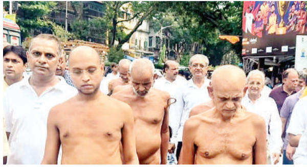
दिगंबर जैन मंदिर के लिए संपन्न हुआ।