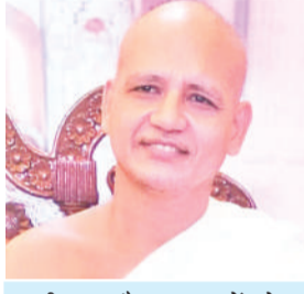
छत्तीसगढ़ जैन समाज में शोक की लहर, अपूरणीय क्षति