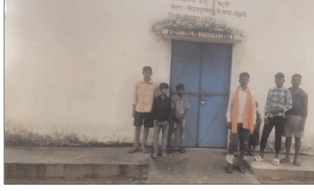
किया गया था।

बाइक एंबुलेंस कभी बनी थी ग्रामीणों की जीवनरेखा- सरकार ने दुर्गम क्षेत्रों में स्वास्थ्य सेवाएं सुलभ कराने के उद्देश्य से लाखों रुपये खर्च कर महुली उप स्वास्थ्य केंद्र के लिए बाइक एंबुलेंस उपलब्ध कराई थी। उस समय जिला प्रशासन ने इसे बड़ी उपलब्धि बताया था और इसका व्यापक प्रचार-प्रसार भी किया गया था। समाचार पत्रों में भी इस पहल को प्रमुखता से प्रकाशित