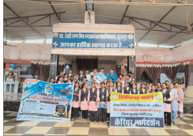
विद्यार्थियों को बताया गया कि भर्ती के लिए निर्धारित शैक्षणिक योग्यता, आयु सीमा, शारीरिक एवं चिकित्सीय

दिशा में विशेष कैरियर मार्गदर्शन एवं जागरूकता प्रदान करना था। कार्यक्रम में वायु सेना के अधिकारियों ने विद्यार्थियों को भारतीय वायु सेना की गौरवशाली परंपरा, राष्ट्र की सुरक्षा में उसकी महत्वपूर्ण भूमिका तथा अनुशासन, समर्पण और देशसेवा के मूल्यों से अवगत कराया। अधिकारियों ने बताया कि भारतीय वायु सेना युवाओं को सम्मानजनक कैरियर, आधुनिक तकनीक के साथ कार्य करने का अवसर, उत्कृष्ट प्रशिक्षण तथा उज्वल भविष्य प्रदान करती है। कार्यशाला के दौरान अनिवार्य वायु सेना सहित अन्य भर्ती योजनाओं की जानकारी दी गई।