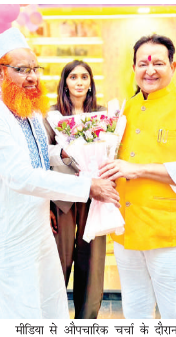
मिडिया से औपचारिक चर्चा के दौरान